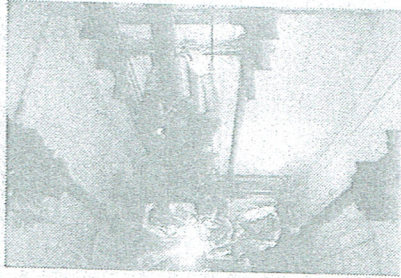
エレベーターの保守点検作業の様子

京都中央区)は、設置から20年以上たった油圧式エレベーター(以下E V)を中心に、リニアアル事業を東京・名古屋・大阪など大都市圏で新